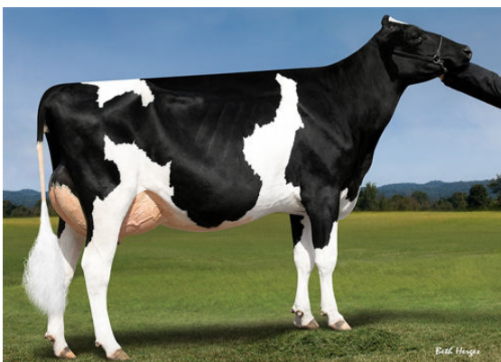
OCD JEDI TAYA 37904 THIRD DAM